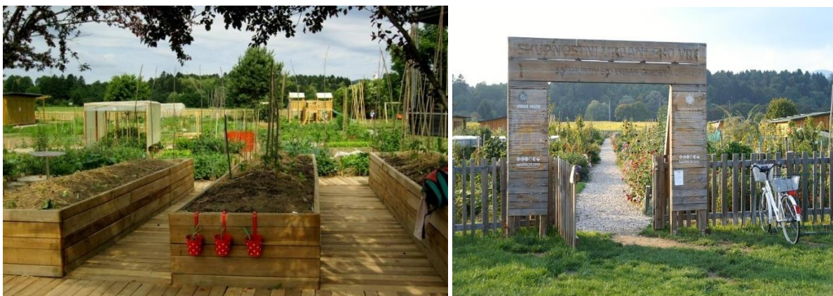
Slika: Skupnostni urbani vrt v Mariboru