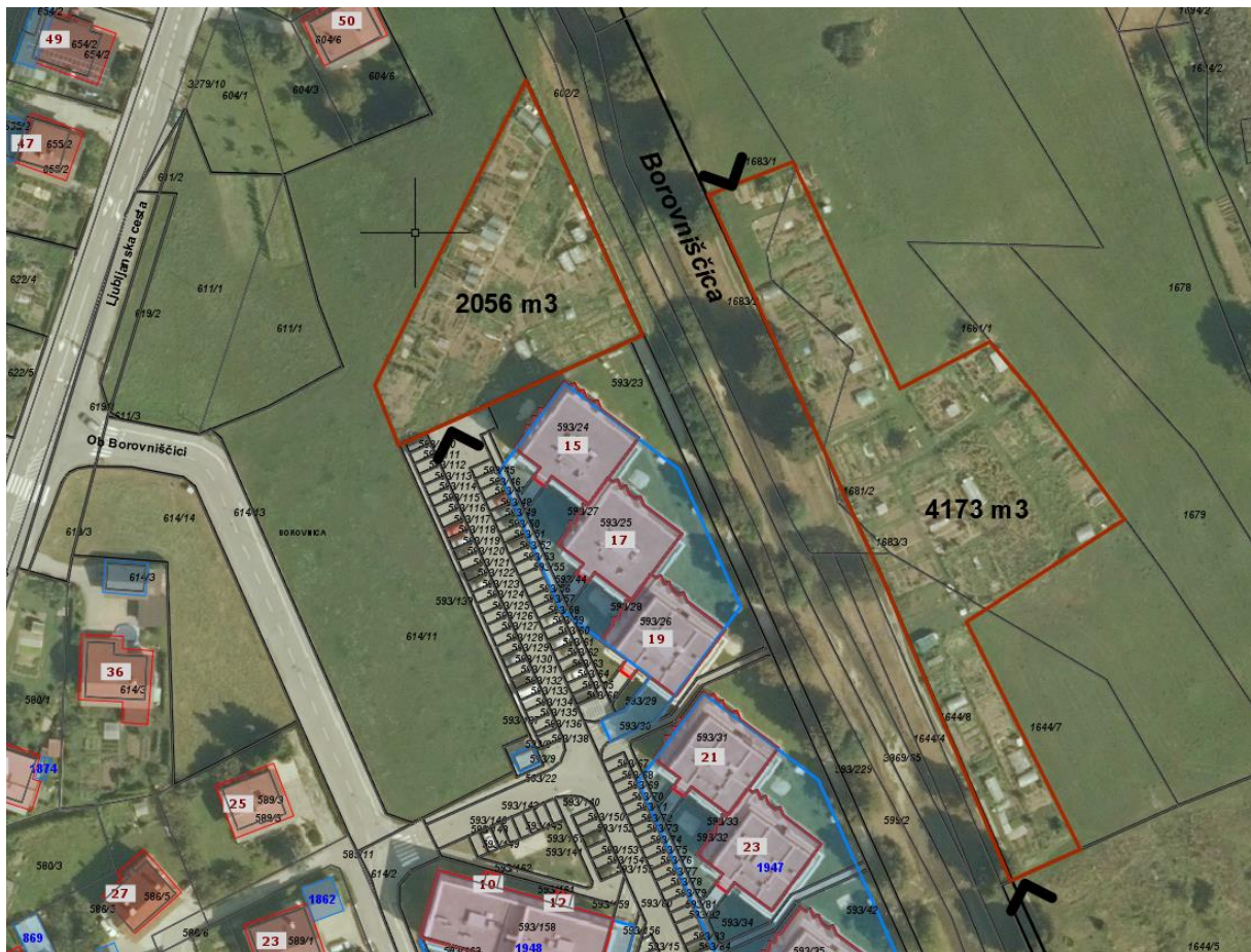
Slika: Prikaz površine območja obstoječih vrtičkov