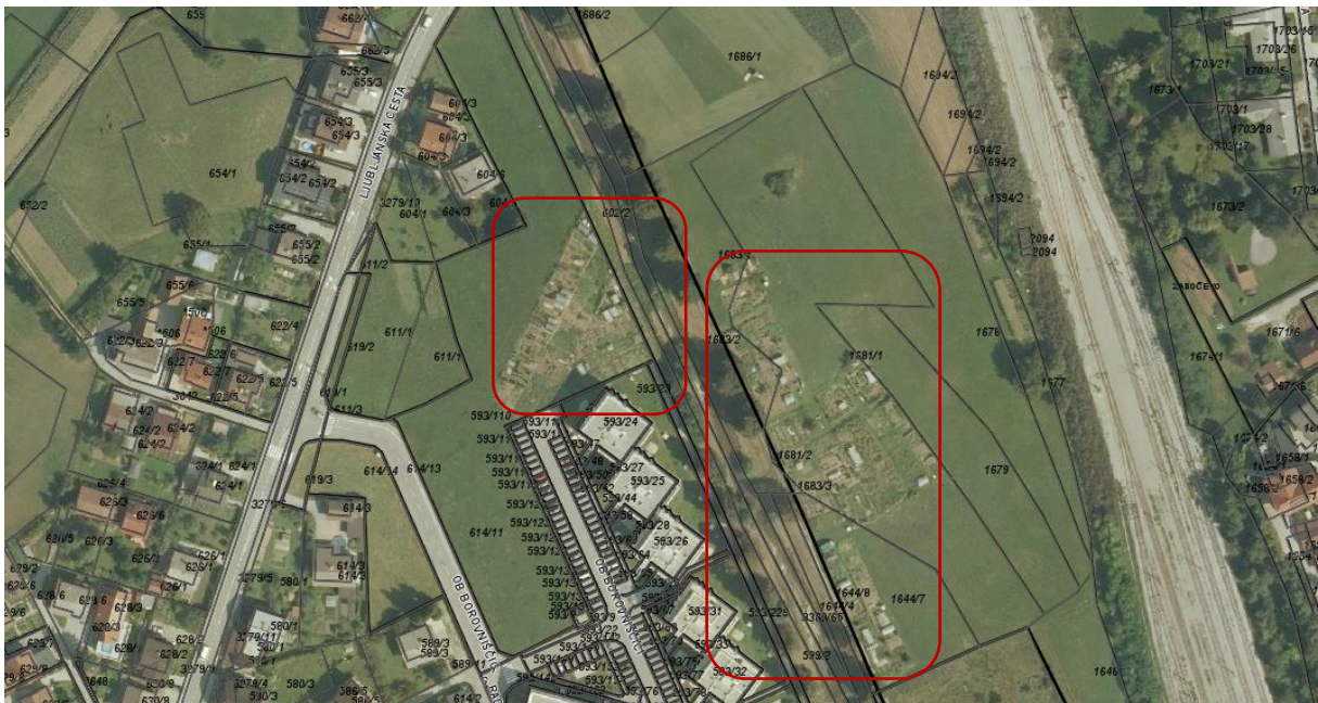
Slika: Lokacija vrtilčkov na orotofoto

Območje vrtilčkov ob Borovniščici je nastalo neorganizirano na zemljiščih v zasebni lasti, ki jih lastniki zemljišč dajejo v najem. Območje ima določeno namensko rabo stavbnih zemljišč za centralne dejavnosti, kjer je še treba sprejeti podrobnejši izvedbeni akt (OPPN). Območje leži v bližini večstanovanjskih objektov, kar omogoča dobro dostopnost ter možnost namakanja zaradi bližine vodotoka. Kljub temu pa na območju obstajajo določeni problemi, ki kličejo po ureditvi območja: opredeljeno vodovarstveno območje (III.), Kulturna krajina Ljubljansko barje, območje potencialne poplavne ogroženosti (opozorilna karta poplav) ter prostorsko nenačrtovano in neoblikovano območje brez kakršnihkoli regulacij dajejo vtis neurejenosti. Vse navedeno zahteva preverbo ustreznosti lokacije, načine urejanja območja ter iskanje možnosti za načine urejanja območja tudi skozi ustrezne prostorske izvedbene pogoje.