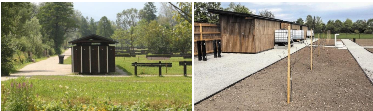
Slika: Levo Park Rakova Jelša v Ljubljani z vrtničarskim območjem in na Brodu (slika desno)